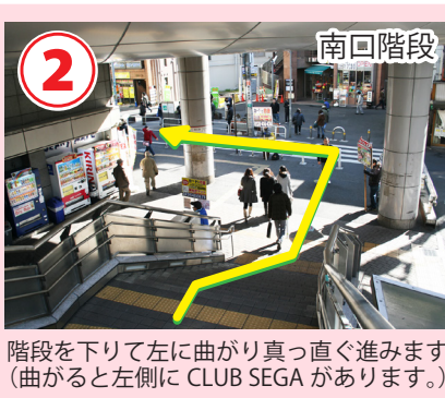
階段を下りて左に曲がり真っ直ぐ進みます。(曲がると左側に CLUB SEGA があります。)