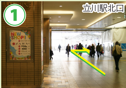
北口からデッキへ出てすぐ右に向かいます。

立川駅北口→TDS 距離：1.1km 時間(4.8km/h)：13分 歩数：1350歩 消費カロリー 53 kcal おにぎり 0.3個分