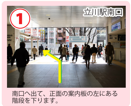
南口へ出て、正面の案内板の左にある階段を下ります。