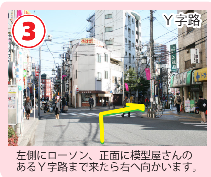
左側にローソン、正面に模型屋さんのあるY字路まで来たら右へ向かいます。