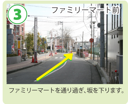
ファミリーマートを通り過ぎ、坂を下ります。