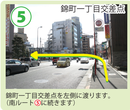
錦町一丁目交差点を左側に渡ります。(南ルート⑤に続きます)