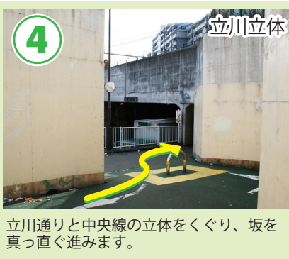
立川通りと中央線の立体をくぐり、坂を真っ直ぐ進みます。