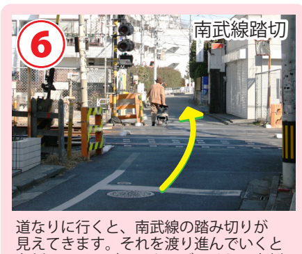
道なりに行くと、南武線の踏み切りが見えてきます。それを渡り進んでいくと左側にライフジョイクラブ、そして右側に教習所の建物が見えてきます。

立川駅南口→TDS 時間(4.8km/h)：12分 消費カロリー 49 kcal 距離：0.9km 歩数：1170歩 おにぎり 0.3個分