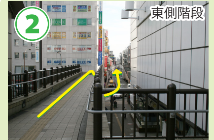
階段を下りて真っ直ぐ進みます。左側に郵便局、右側にルミネがあります。