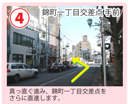
真っ直ぐ進み、錦町一丁目交差点をさらに直進します。