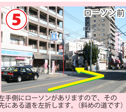
左手側にローソンがありますので、その先にある道を左折します。(斜めの道です)