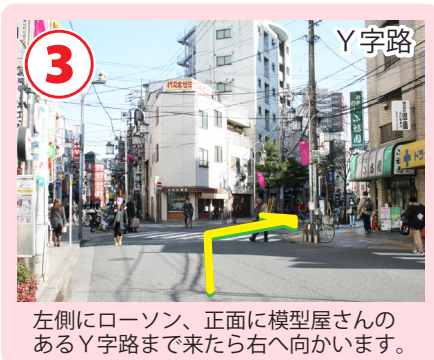
左側にローソン、正面に模型屋さんのあるY字路まで来たら右へ向かいます。