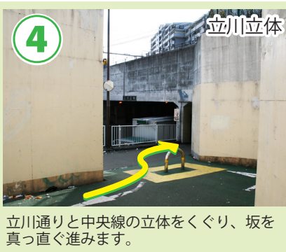
立川通りと中央線の立体をくぐり、坂を真っ直ぐ進みます。