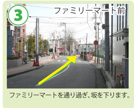
ファミリーマートを通り過ぎ、坂を下ります。