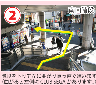
階段を下りて左に曲がり真っ直ぐ進みます。(曲がると左側に CLUB SEGA があります。)