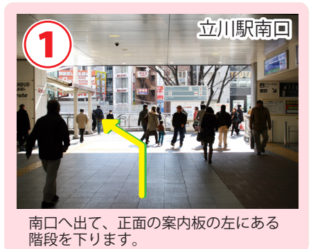
南口へ出て、正面の案内板の左にある階段を下ります。